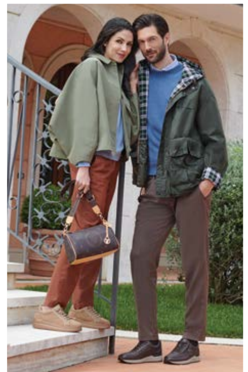
Villa Valentini Bonaparte, Castiglione del Lago L'INIZIO DI UN VIAGGIO NEL CUORE D'ITALIA...